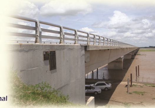
Sistema Multimodal: Proyecto Vial-Portuario Motacucito - Mutún - Puerto Bush

El Tinto - San José: tramo El Tinto - Pte. Quimome Aguaiques - San Pedro: tramo III Guabirá - Chané: tramo I Santa Cruz - Cotoca Concepción - San Ignacio Monteagudo - Muyupampa (Chuq - Scz)