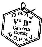
Milton Claros Hinojosa MINISTRO Ministerio de Obras Públicas, Servicios y Vivienda