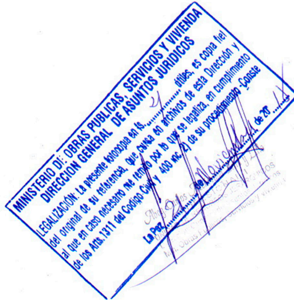
Milton Claros Hinojosa MINISTRO Ministerio de Obras Públicas, Servicios y Vivienda